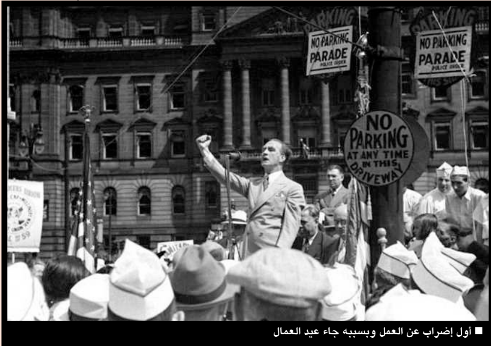
■ أول إضراب عن العمل وبسببه جاء عيد العمال

يحتفل به في يوم 1 مايو وهو يوم عطلة عامة. في كثير من البلدان يسمى بعيد العمال العالمي أو عيد العمال، حيث يتم تنظيم احتفالات من قبل النقابات العمالية والاتحادات والجماعات الاجتماعية. وهو يوم عطلة في الكثير من الثقافات.