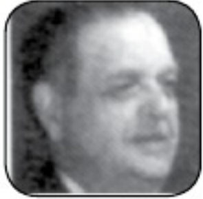
فؤاد سراج الدين