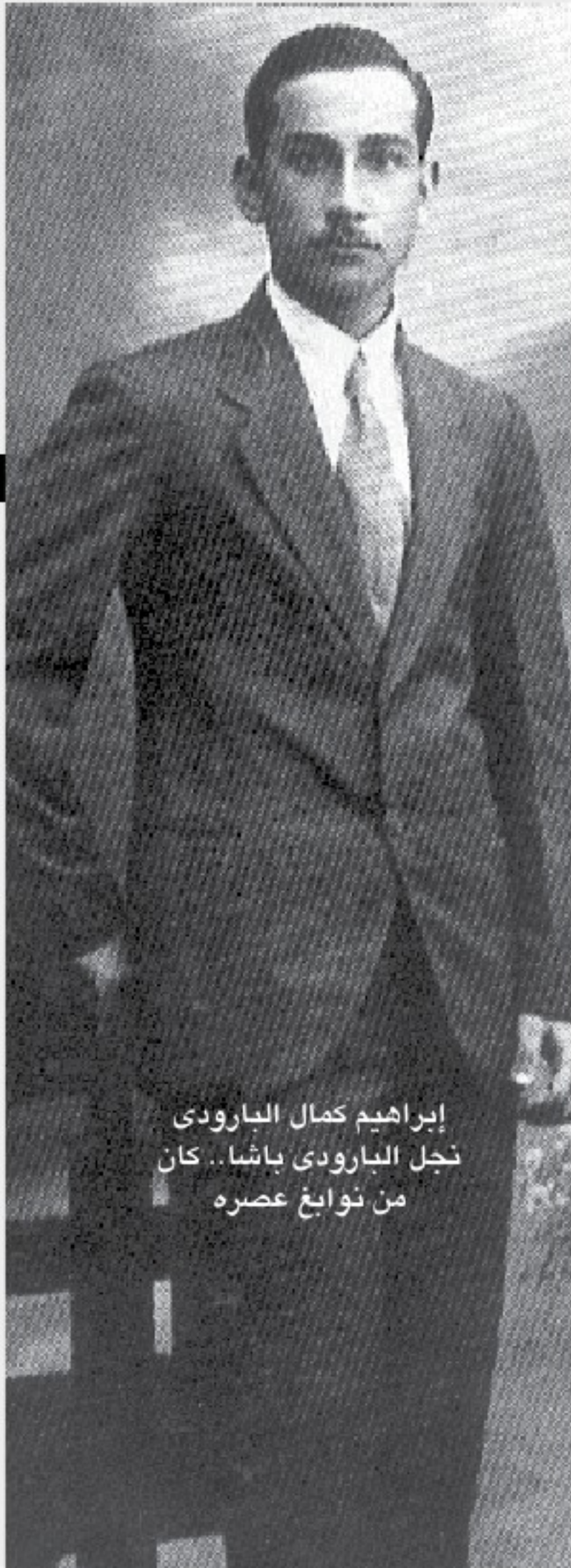
إبراهيم كمال البارودي نجل البارودي باشا.. كان من نوابغ عصره