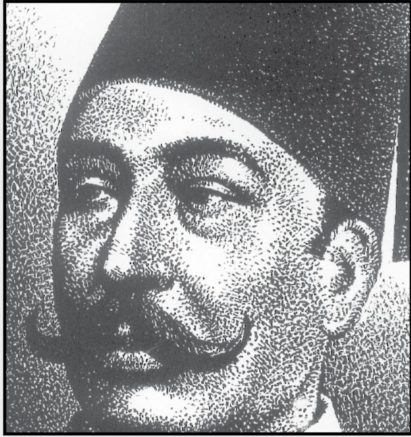
■ محمود سامي البارودي.. بريشة الفنان الكبير محمد حجي