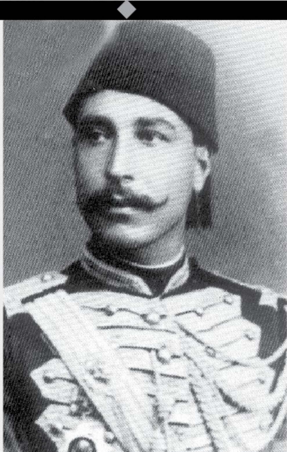
في شبابه كان رمزا للنبل والوطنية ويعشق مصر.. ساند الثورة العرابية بأمواله وكان شديد الثراء