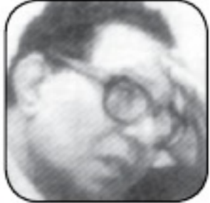
أحمد بهاء الدين